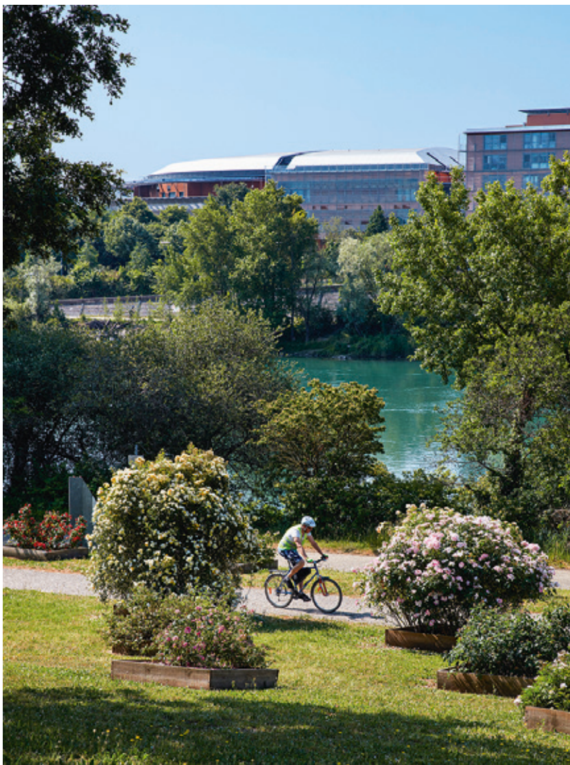
Vue de la roseraie de Saint-Clair