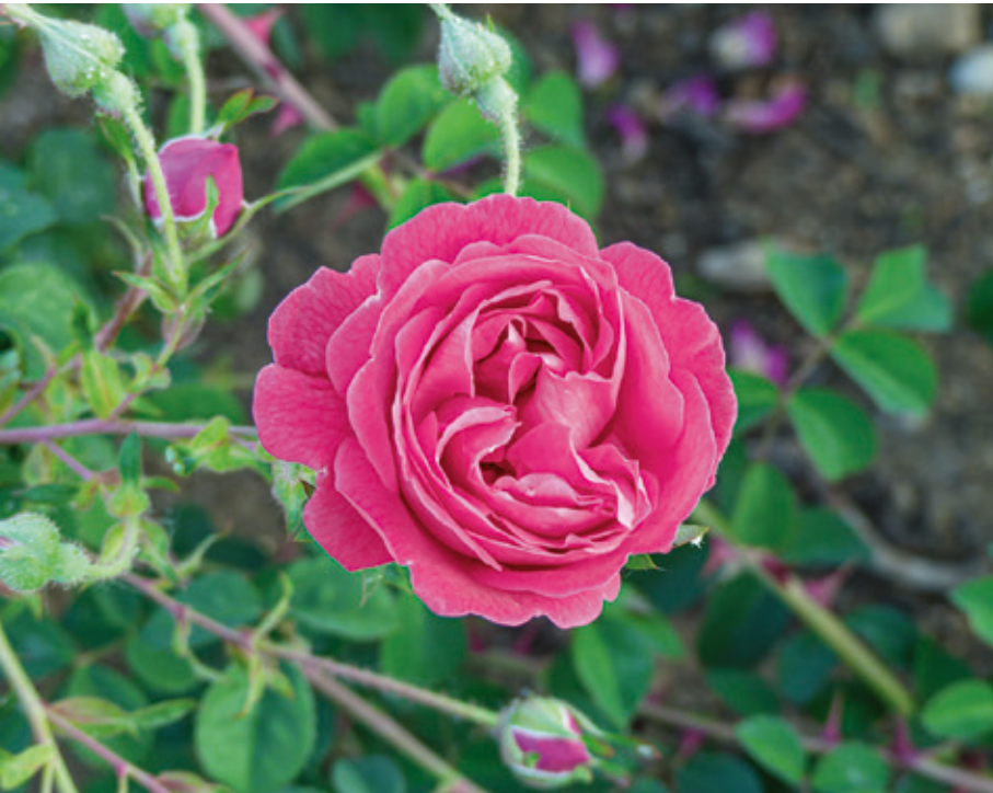
‘Cerise Bouquet’ © Maurice Jay

Pour feuilleter un extrait du livre, CLIQUER ICI