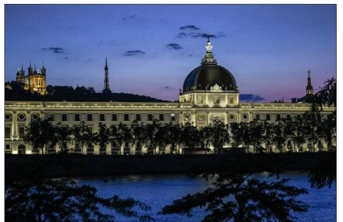
Le Grand Hôtel-Dieu reste un monument incontournable du paysage lyonnais. Il regroupe aujourd'hui des commerces, des restaurants ou encore des bureaux.