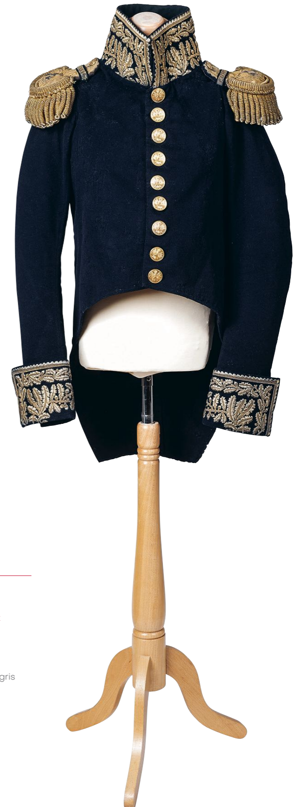
Frac de petite tenue du général de division Joseph-Marie Dessaix au règlement du 21 vendémiaire An XII

1814, drap de laine bleu national, sergé de soie gris foncé, fil d'or, cannetille d'or et d'argent, laiton doré.