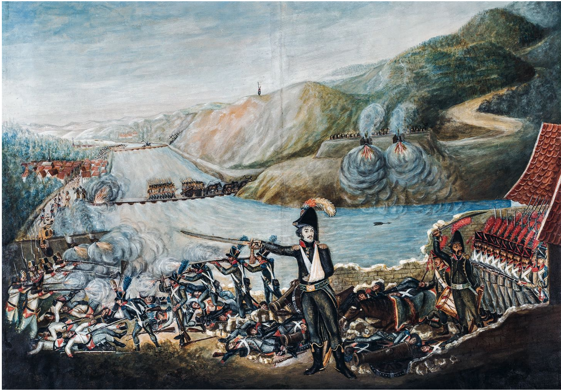
Joseph-Marie Dessaix, colonel commandant la 4 e demi-brigade légère au combat de Mori, le 18 fructidor An IV (4 septembre 1796)

Vers 1800, gouache sur papier vergé maroufflé sur toile. Silhouette de Dessaix découpée et rapportée. Tête peinte sur ivoire.