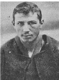
Sadi Geronimo Caserio, 1873-1894.

« Les livres et les idées ne font pas la révolution. Un siècle qu'on l'attend celle-là ! Pour faire exploser le système et entraîner le peuple, au point où nous en sommes, des actes valent mieux que des paroles. Et là, des types comme moi doivent prendre leur part. Ma dague à double tranchant en fera des dégâts, dans le gras de la République. Le désespoir d'un seul donnera du courage à tous les autres. »