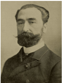
Sadi Carnot, 1837-1894.

Pour feuilleter un extrait du livre, cliquer ici .