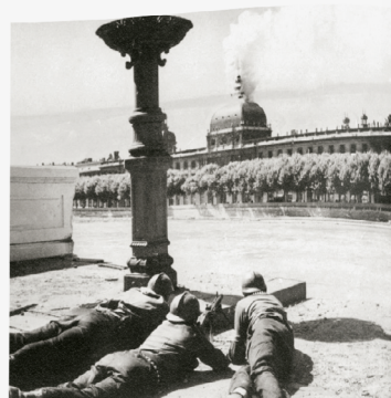
Le 4 septembre 1944, le dôme de l'Hôtel-Dieu s'embrase à la suite de réactions chimiques provoquées par des incendies survenus dans le dôme et des soldats des forces françaises posés sur la rive gauche du Rhône.

Aujourd'hui comme hier, franchir la porte de l'Hôtel- Dieu c'est faire l'expérience d'une certaine forme de réconfort et de douceur.