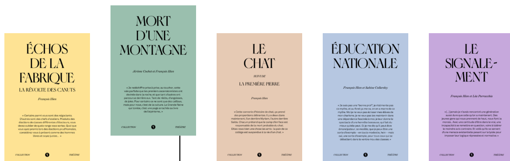
Cycle des Hautes Aigues