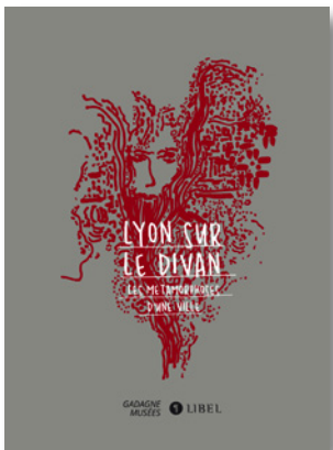
LYON SUR LE DIVAN. LES MÉTAMORPHOSES D'UNE VILLE