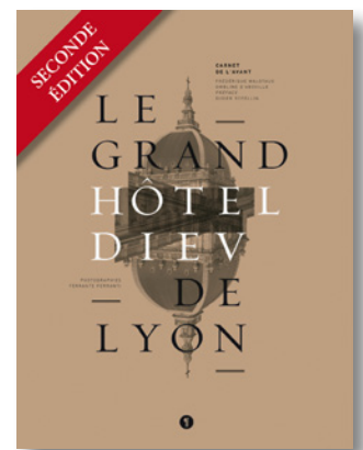
LE GRAND HÔTEL DIEU DE LYON. CARNET DE L'AVANT

POUR SUIVRE TOUTE L'ACTUALITÉ DES ÉDITIONS LIBEL, CLIQUER ICI